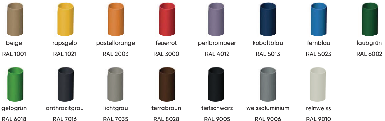
beige RAL 1001 rapsgelb RAL 1021 pastellorange RAL 2003 feuerrot RAL 3000 perlbrombeer RAL 4012 kobaltblau RAL 5013 fernblau RAL 5023 laubgrün RAL 6002 gelbgrün RAL 6018 anthrazitgrau RAL 7016 lichtgrau RAL 7035 terrabraun RAL 8028 tiefschwarz RAL 9005 weissaluminium RAL 9006 reinweiss RAL 9010